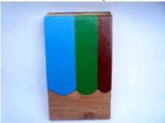
4. Dasar/media plat besi